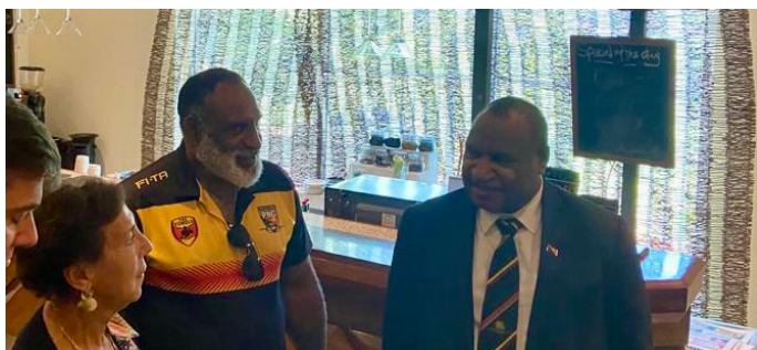
Photo : J.Marape avec la délégation du Sénat-2 Sept 022

Les observateurs électoraux du Commonwealth ont fait le constat d'une procédure de vote entachée de très nombreuses irrégularités, comme régulièrement en PNG.